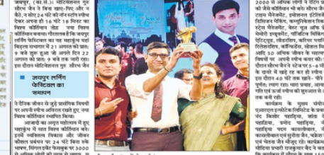
24 घंटे का नॉन स्टॉप स्पीच देकर बनाया कीर्तिमान